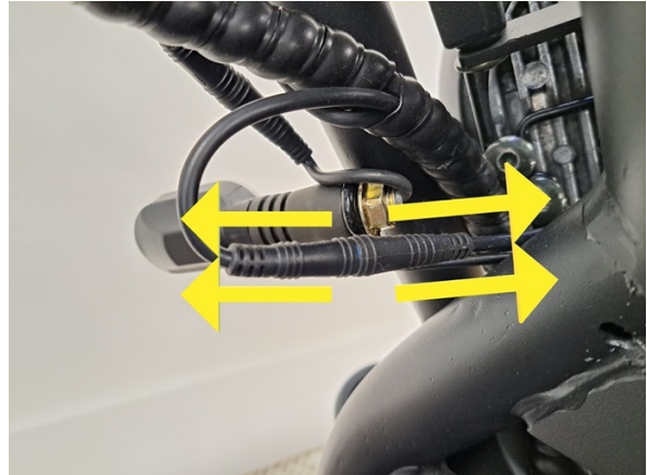
Avaa etuvalon liitin.