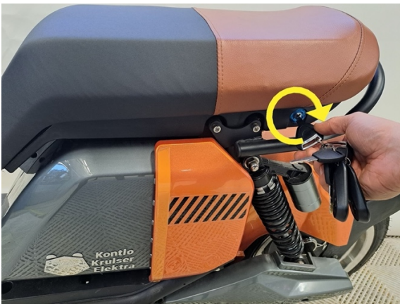
Avaa penkinlukitus avaimella.