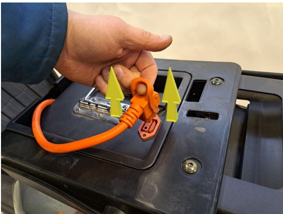
Irrota akun pistoke akusta.